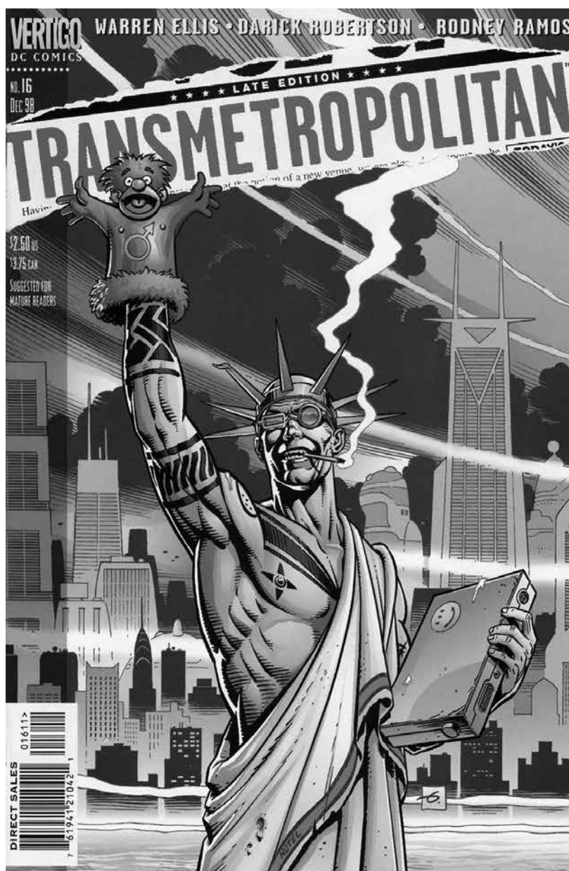
▪ Transmetropolitan , 1998 | Warren Ellis, Darick Robertson y Rodney Ramos | DC Comics

Como parte del mandato, la violencia cumple una función deshistorizante de los procesos comunicativos, sea por su eterna reiteración o por su letalidad, que hace imposible las articulaciones y las operaciones para ubicarla en una temporalidad colectiva. Su repetición incesante no sólo disloca el principio de realidad, sino que impide fijarla en una estructura temporal, porque siempre está pasando, no termina de suceder. Parece imposible contar la historia de las violencias, sólo son posibles relatos en primera persona, como operaciones divergentes, porque la experiencia última de las violencias es imposible.